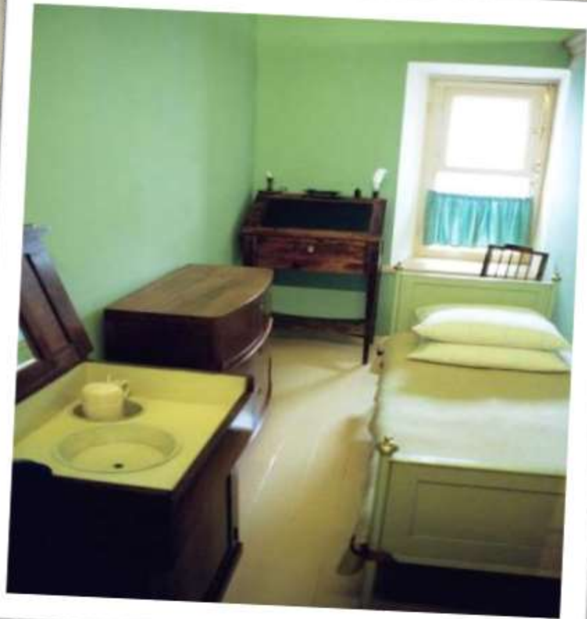
Комната лицеиста Александра Пушкина