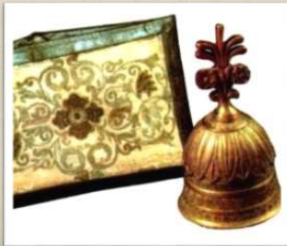
Бумажник и бронзовый колокольчик