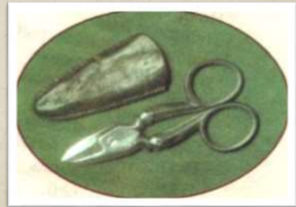
Ножницы и кожаный футляр