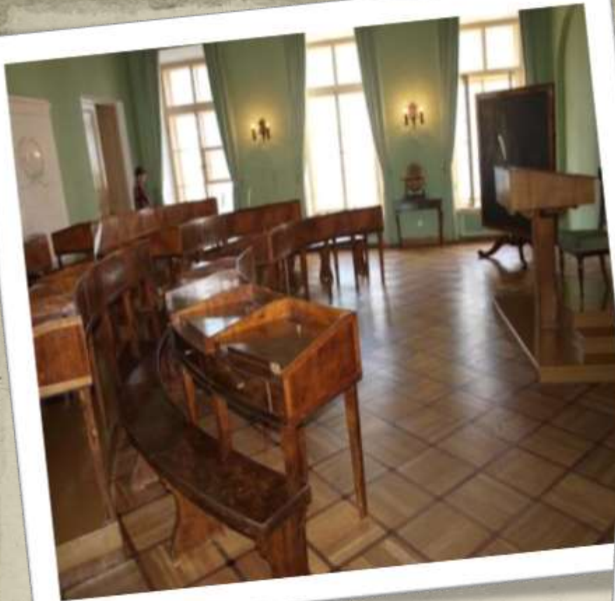
Учебная аудитория Царскосельского Лицея