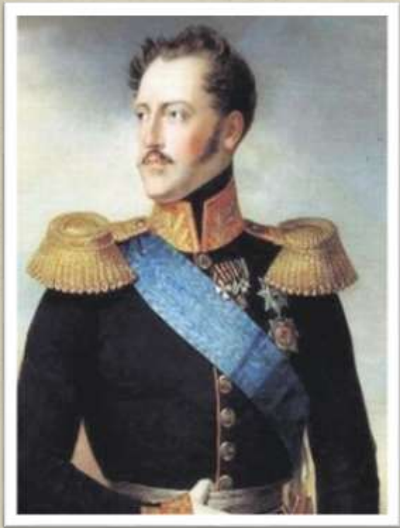
Француз Жорж Шарль Дантес