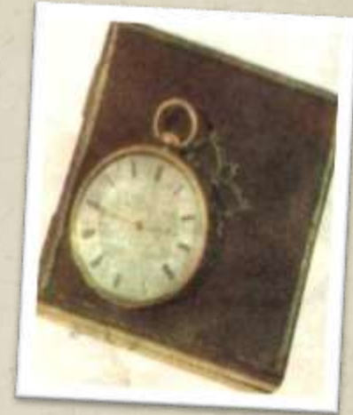
Карманные часы поэта