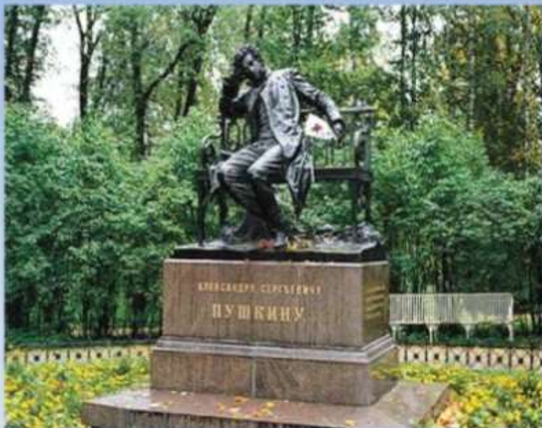
Памятник Пушкину - лицеисту в Царском селе. Скульптор Р. Бах

19 октября 1811 года в Царском Селе был открыт Императорский Лицей.